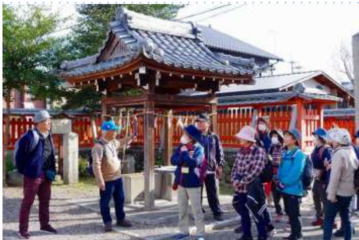
酒井神社／ちと疲れまして!?