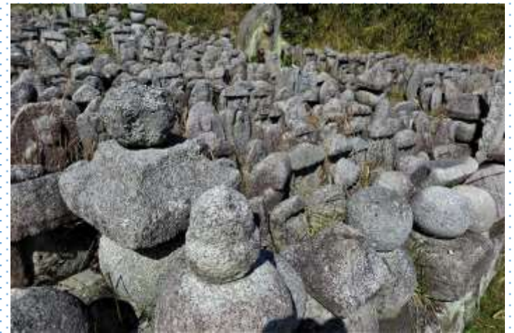
山の辺の道・千体地藏