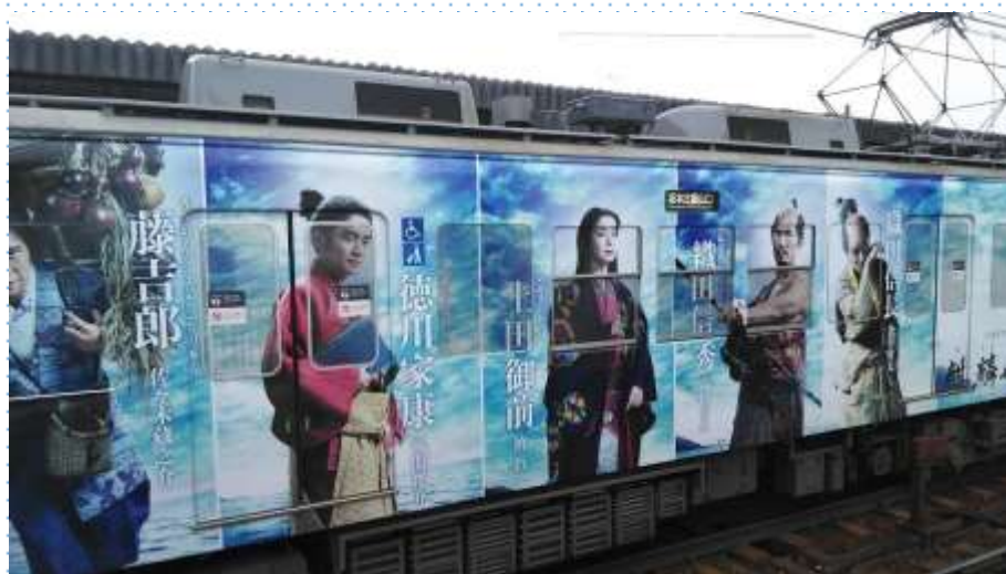
ラッピングは2月21日からのようです。