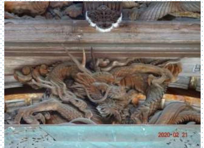
麒麟ではありません。