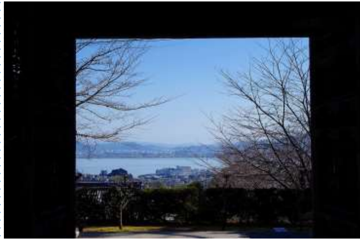
西教寺から琵琶湖を望む