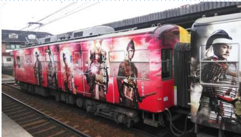
京阪電車の「麒麟が来る」ラッピング