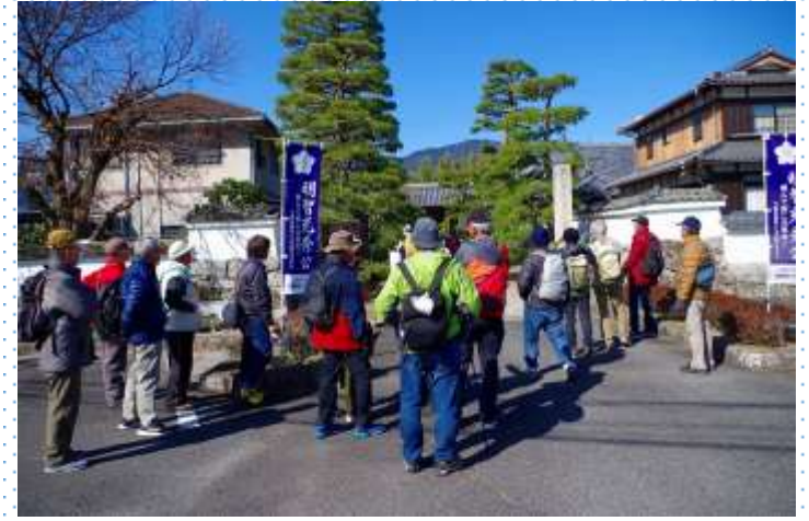
さあ出発です・まずは聖衆来迎寺へ