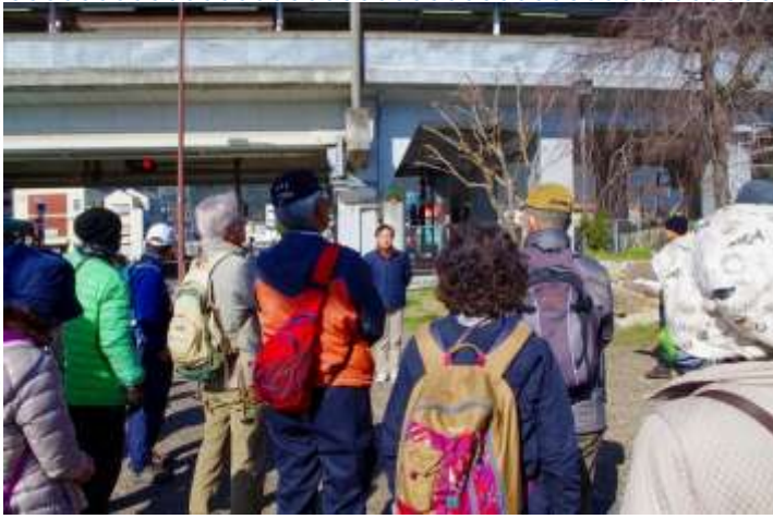
比叡山坂本駅での高山会長挨拶