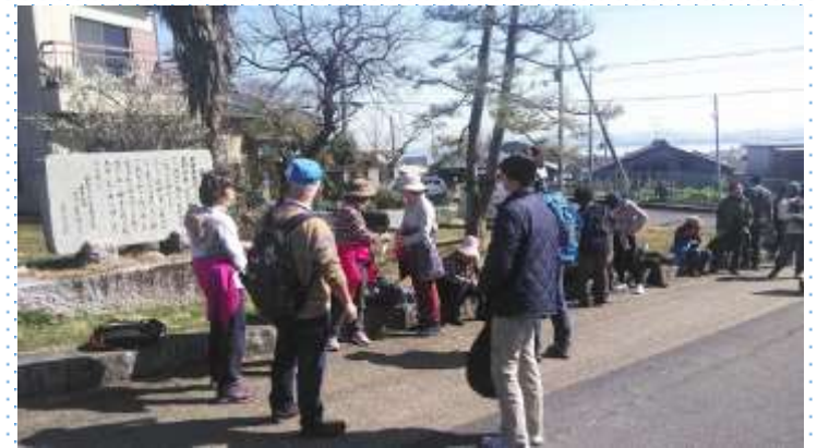
西教寺への坂道がキツイ！