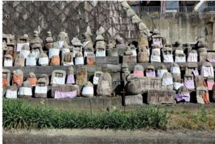
お地藏さん大集合です！