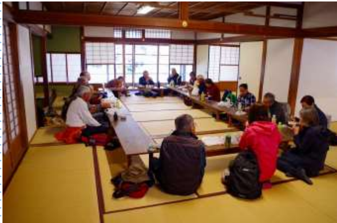
日吉会館での昼食風景