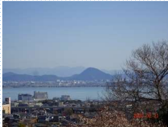
山の辺の道から見る近江富士