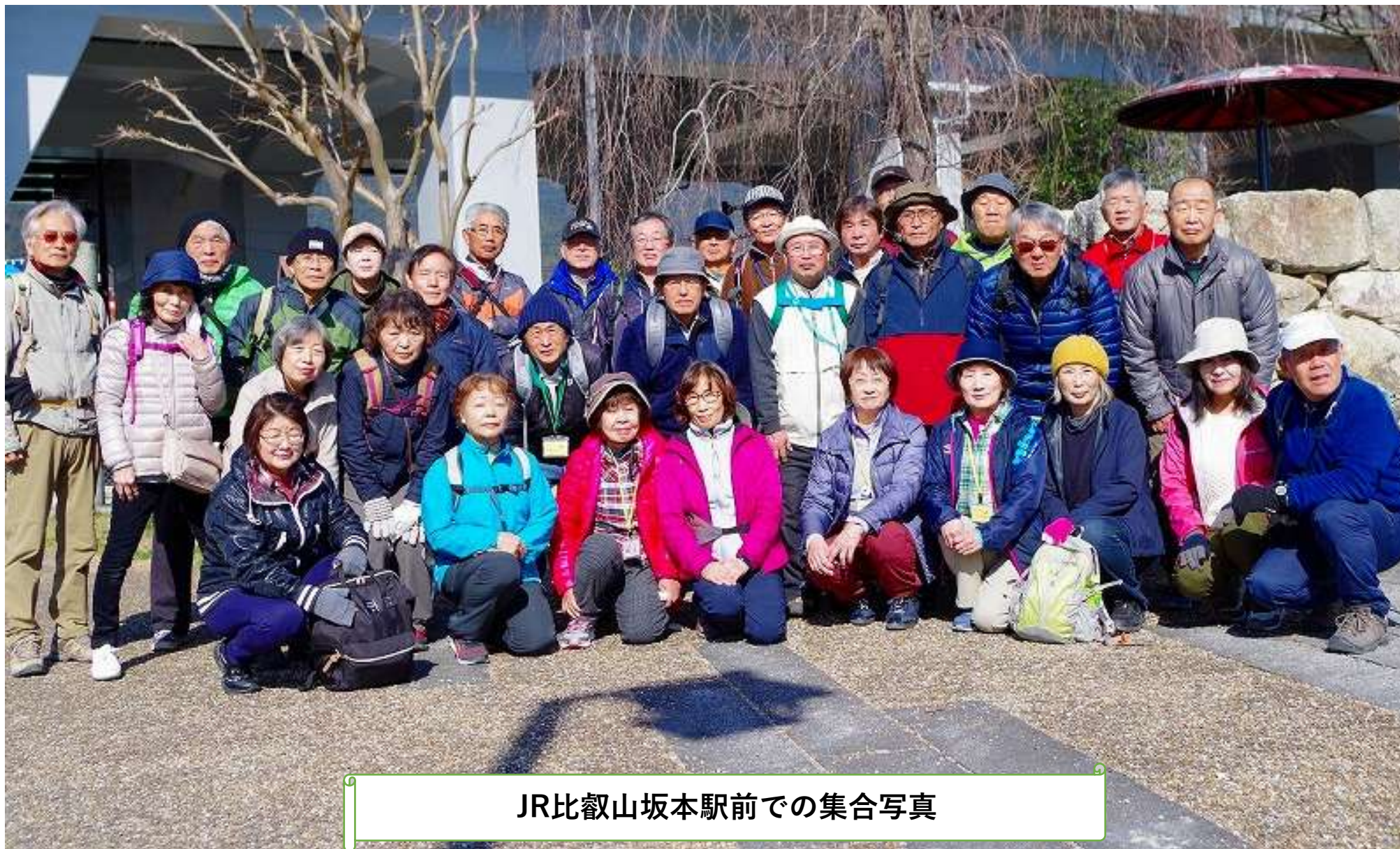
JR比叡山坂本駅前での集合写真